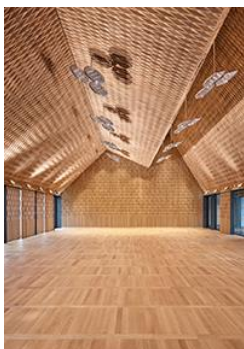
Gold Schreinerarbeiten Drei-Häuser-Hotel «Caspar», Muri AG Bild Luca Zanier