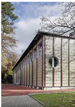
Gold Holzbauten Wiederverwendbare Sportbauten, Zürich ZH

Der alle drei Jahre verliehene Prix Lignum zeichnet die besten neuen Schweizer Holzbauten und Schreinerarbeiten aus. Gestern Donnerstag wurden die nationalen Gold-, Silber- und Bronze-Gewinner 2024 in Bern bekanntgegeben. Heute Freitagabend werden die sechs ausgezeichneten Projekte in der Preis-Region Mitte geehrt.