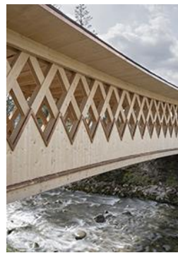
Bronze Holzbauten Passerelle des Buissons, Bulle FR