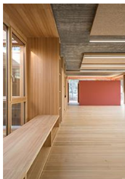
Silber Schreinerarbeiten Sanierung Haus 8, Kli- nik Beverin, Cazis GR