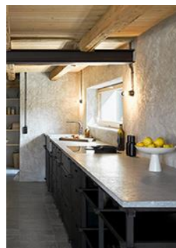
Bronze Schreinerarbeiten Küche «Ater Culina», Volketswil ZH