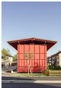
Silber Holzbauten Pappelhöfe, Wohnkolonie im Hard, Langenthal BE